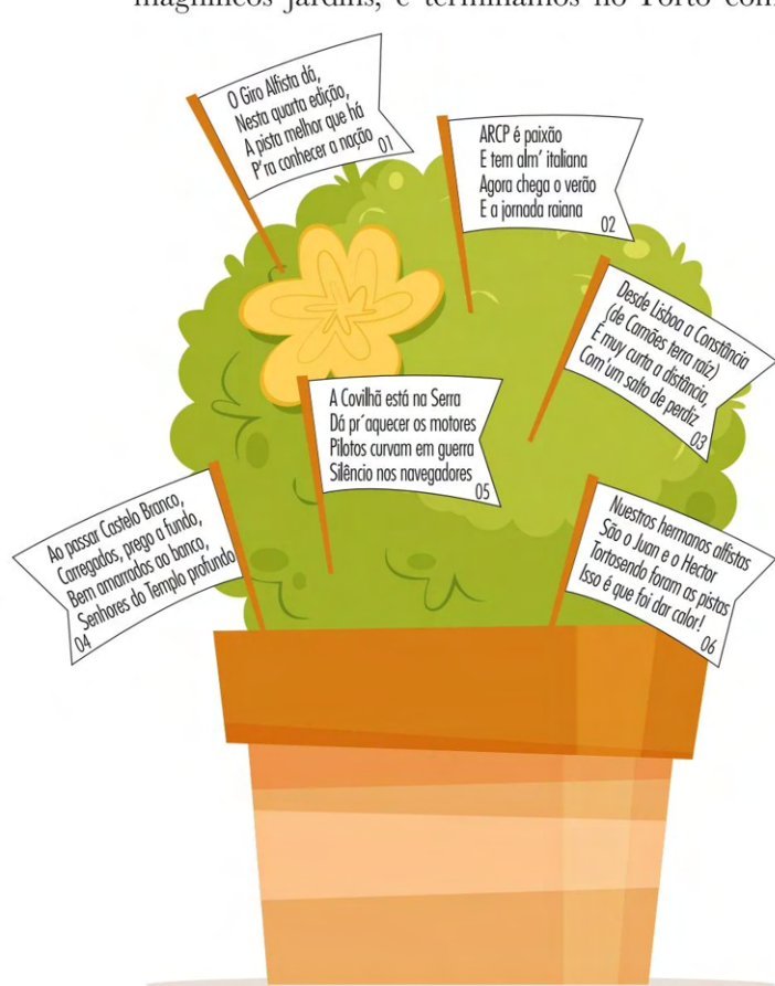
Dia 10 de Junho Lisboa-Constância-Castelo Branco-Covilhã