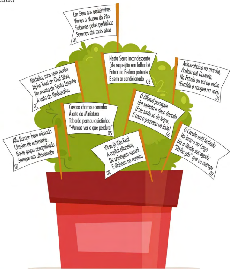
Dia 11 de Junho Covilhã -Seia-Gouveia-Vila Real